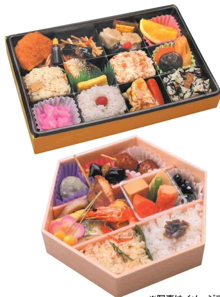
※写真はイメージです。

★ 優待・サービス ★ 区民・産業プラザご利用の方は10%割引にて提供させていただきます。