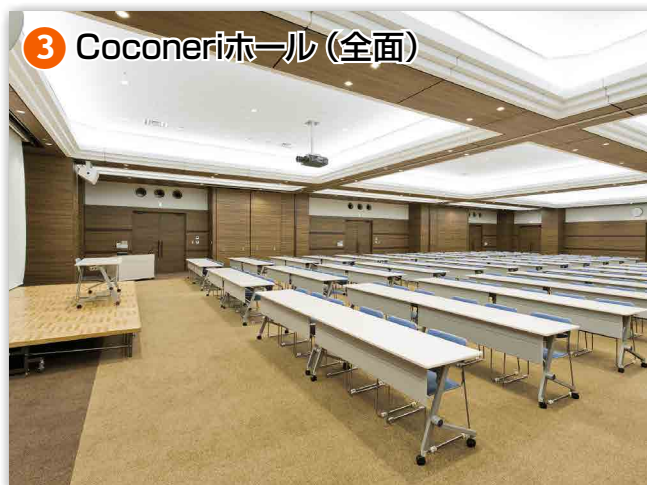
③ Coconeriホール (全面)