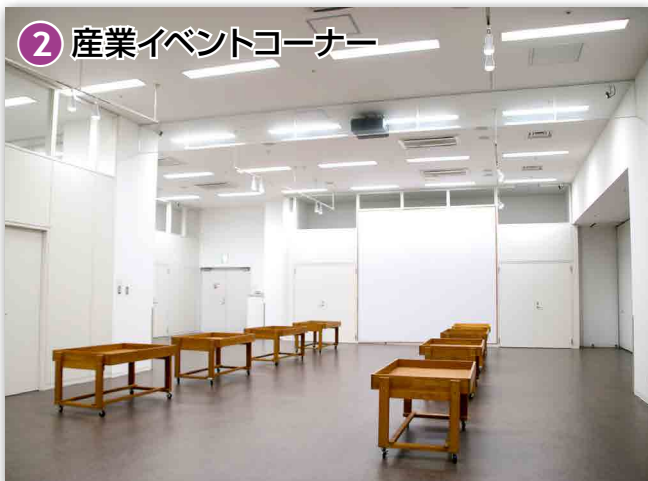
② 産業イベントコーナー