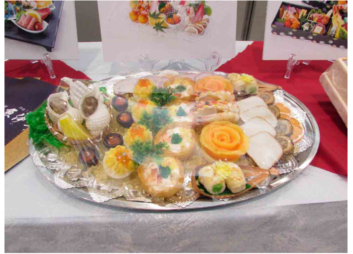
(令和元年ケータリングイベントの様子) ※令和2年～4年はコロナウイルスのため中止