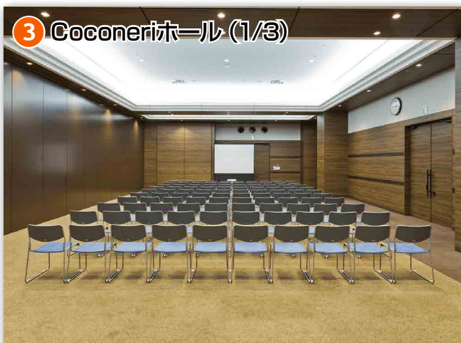
③ Coconeriホール (1/3)