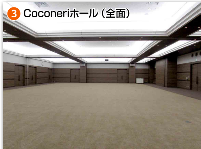
③ Coconeriホール (全面)