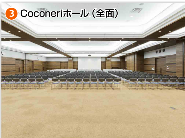
③ Coconeriホール (全面)