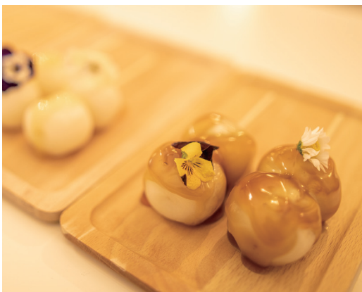
▲だんごにエディブルフラワーをトッピングした「花だんご」は、人気のオリジナルメニュー。ドリンクも充実しています。

集客方法のメインはSNSです。開店当初はチラシのポスティングなどもしていましたが、今はSNS、特にInstagramに絞っています。様々な方法を試してみましたが、Instagramが一番一つながっていき、実感がありますね。お客様がハッシュタグをつけて投稿してくれるので、少しずつお店が地域で認知されてきました。より多くのお客様に、もっとInstagramに