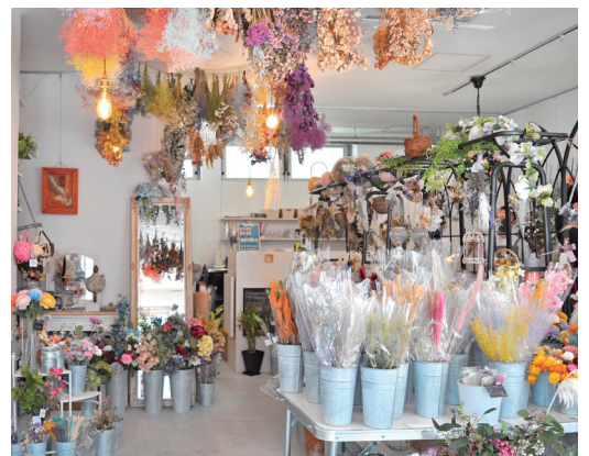
▲色鮮やかなアレンジメントフラワーでいっぱいのかわいい店内。向かって左がショップスペースで右奥がカフェ。

前職では、ドライフラワーやプリザーブドフラワーなどの花素材や雑貨を開発製造する会社に勤めていました。以前から自分のお店を持ちたいと思っていたので、念願の独立でした。ショップにカフェを併設したのは、お客様の入店のしやすさを重視したためです。カフェに来たお客様が、お花や雑貨も見ることが出来る「フラワーカフェ」という業態にしました。