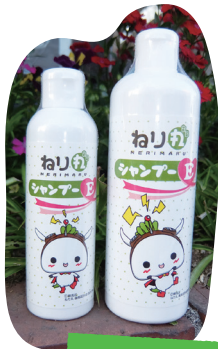
ねり丸 シャンプー-E