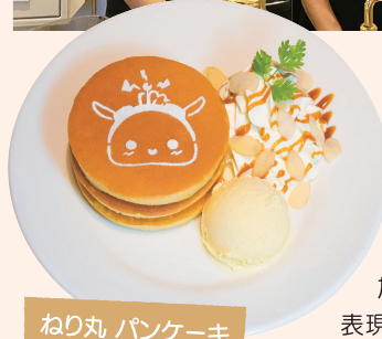
ねり丸 パンケーキ

6年前からねり丸をココアパウダーで再現した「ねり丸ラテ」と「ねり丸パンケーキ」を提供し始めました。元々のデータのままでラテ型に落とし込むことができなかったので、少しアレンジを加えました。カフェラテは、ココアパウダーで表現したねり丸が綺麗に乗るように、通常のラテよりミルクの泡を少し多めにしています。パンケーキでは、溶けない粉砂糖を使用し、どちらも綺麗に再現できるように工夫しています。ねり丸メニューを始めてから、SNSを見て来店されるお客様が増えました。テーブルに運ぶと「写真のまんま!」と喜んでくれます。「ねり丸の部分がかなくて食べられない」と言うお客様もいて可愛いです(笑)。