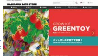
ネットショップのトップ画面。写真や色使いが目を引くデザインです。

1人でできることには限界があるので、仲間を集めるといいですよ。商品企画、仕入、デザインなど、得意分野のある人たちが集まるとショップの強みになります。練馬の商店も連携すれば、チーム力のあるサイトが作れるのではないかと思います。「これ売りたい」という熱い思いさえあればGOです!