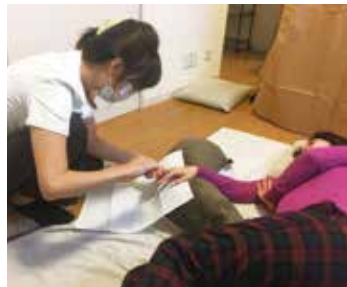
寝たきりの利用者さんに、爪ケアを行っている様子

しかし現実には、深爪で傷つけるなど、人の爪を切る難しさに、多くの介護スタッフが悩んでいました。「この問題を解決したい!」という社会的使命感が、爪ケアの出発点に。