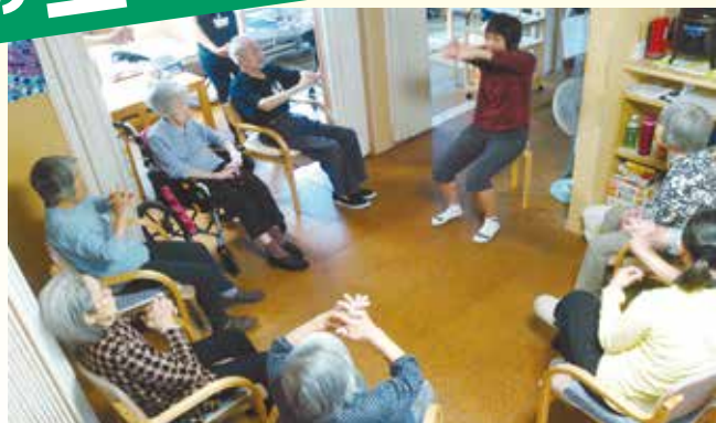
小規模多機能型居宅介護「たがらの家」。健康体操をする利用者の皆さん