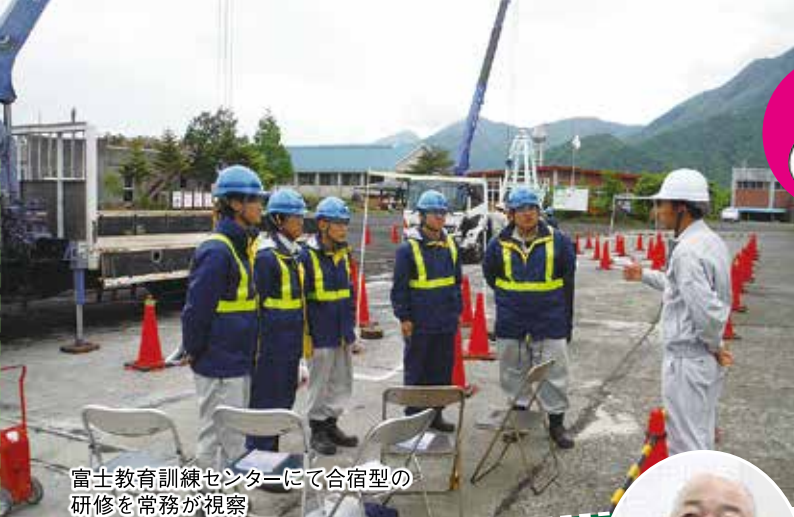
富士教育訓練センターにて合宿型の研修を常務が視察