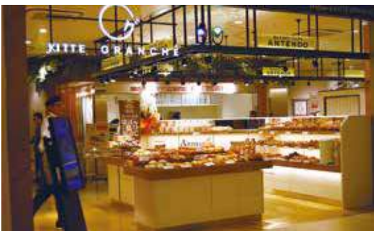
丸の内KITTEにオープンしたベーカリーカフェ ANTENDO

会社の理念をしっかり理解してもらうため、10日間の新人研修を行います。その他にも様々な研修プログラムを用意しており、パン検定を受ける際には会社が受験料を負担してサポートしています。また、定期的に個人面談を行い、「管理職を目指したい」「接客が好きだから販売がしたい」など一人ひとりの希望を聞き、普段から社員との風通しの良いコミュニケーションを心がけています。