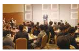
ホテルメトロポリタン池袋にて家族も招待した忘年会

2年に1回は、家族も招待してパーティーを開催。社員のモチベーションが上がり、実際に生産量が増えました。それを考えたら、高くもなんともありません!