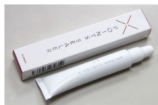
上：一致団結してついてきてくれた従業員 下：新商品を開発

「60年以上の歴史を持つ(株)イケナガで、全国のサロンを相手に営業で飛び回るのが天職だと思っていました。仕事が楽しかったので、イケナガの社長から新しい会社を任せたいと言われながらも、経営のことは何も分からなかつたので断り続けていました。でも説得されているうちに、従業員も一緒に頑張ってくれるという意志が確認できたので、引き受ける決意をしました」