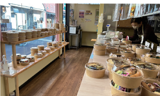
▲「かど26」には毎日たくさんの種類のお弁当が並ぶ。