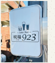
住所:練馬区豊玉北5-15-12 花園ビル3階

NICE! 「くにさん」という読み方がわかると、数字を見るだけでマスターの顔が思い浮かびます。