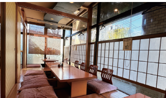
▲「かど36」は広いお座敷があり、団体客にも嬉しい。