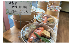
▲「かど26」の看板弁当、のり鮭弁当 490円(令和6年2月現在)

以前は練馬で自然食のお店を営んでいました。その時に高齢の方から「少し高くて美味いものが食べたい。でも自分で作ったり、買いに行くことができない」という声を聞きました。そこで高齢者向けに、品質にこだわったお弁当を作って届けるサービスを始めました。半分ボランチアみたいな感じで始めたので、大きく宣伝はしていなかったのですが、ヘルパーさんが広めてくれて、当時は500名くらいの会員さんがいらしていました。 その後、「無添加でヘルシーなお弁当がある」と保育園や学校の先生たちの間で話題に。注文がたくさん入るようになり、100件近い団体さんから注文を受けていました。 大泉学園で会席料理「かど36」を開業 練馬区が勤労福祉会館の中にある飲食店を運営する人を募集していることになり、審査を受けて、お店を開くことになりました。私が和食が好きだったことから、会席料理のお店にしようと決めました。開店からもう10年になりましたが、素材にこだわった私たちの手作り料理を好きになってくれた方々がずっと通ってくれています。