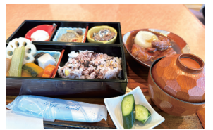
▲「かど36」のランチセット「まごわやさしい」御膳+選べる1品 1,590円