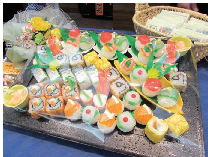
(平成29年11月ケータリングフェア&下見会)