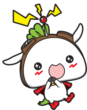
練馬区公式アニメキャラクター ねり丸 ©練馬区