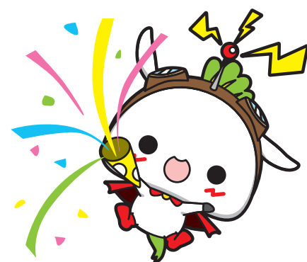
練馬区公式アニメキャラクター ねり丸 ©練馬区

住所 〒171-0032 豊島区雑司が谷3-3-4 電話 03-3980-2781 FAX 03-3980-2717 E-MAIL komazaki@metropolitan.jp URL http://www.foods.metropolitan.jp/ 担当 駒崎 達也 (こまざき たつや) 休業日 年末年始