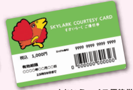
すかいらーくご優待券