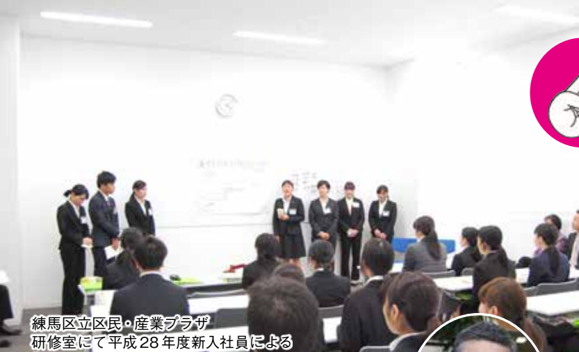
練馬区立区民・産業プラザ 研修室にて平成28年度新入社員による 「研修成果発表」の様子