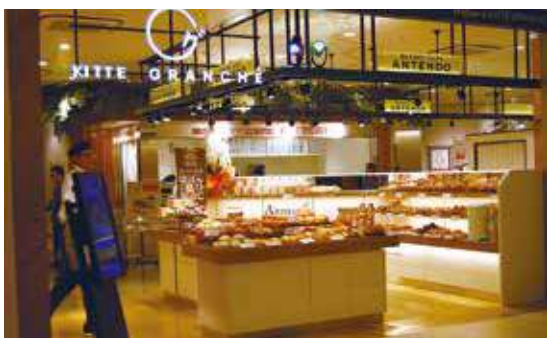
丸の内KITTEにオープンしたベーカリーカフェ ANTENDO

会社の理念をしっかり理解してもらうため、10日間の新人研修を行います。その他にも様々な研修プログラムを用意しており、パン検定を受ける際には会社が受験料を負担してサポートしています。また、定期的に個人面談を行い、「管理職を目指したい」「接客が好きだから販売がしたい」など一人ひとりの希望を聞き、普段から社員との風通しの良いコミュニケーションを心がけています。