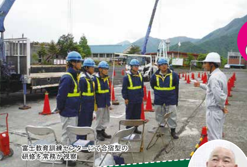
富士教育訓練センターにて合宿型の研修を常務が視察