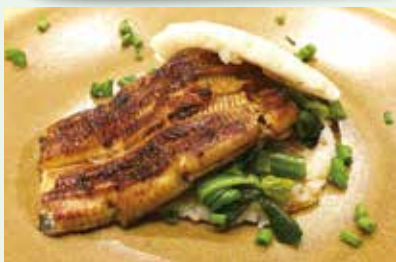
「鰻ライスバーガー」1,500円(税別)は、カジュアルに鰻を楽しめるメニュー♪