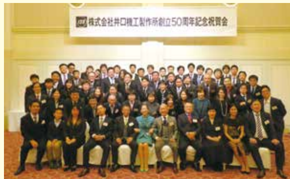
創立50周年記念祝賀会にて