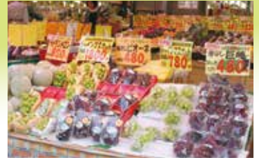
スーパー5店舗分の大量仕入れで、鮮度のいい果物や野菜が毎日店頭に並ぶ。

ノドを潰すほど店頭で声を出し続け、繁盛店を生んだ秋葉さん。ハスキーな声は努力の証しです。