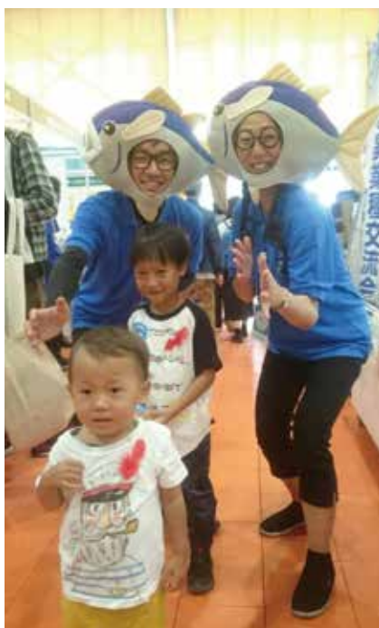
産業見本市の様子。魚の被り物は、子どもたちに人気！

“コロナウイルスを広めない”という社会貢献活動が新たな活路を見出し、さらには社員のモチベーションアップにつながったのです。