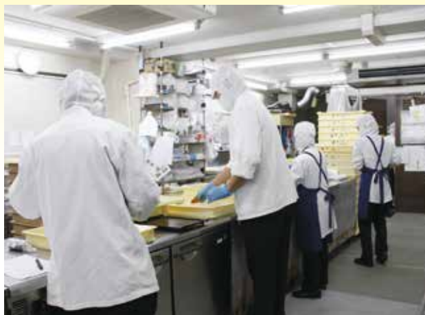
安全面に注意を払いながら調理を行うスタッフ