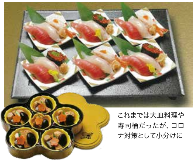
これまでは大皿料理や寿司桶だったが、コロナ対策として小分けに

「料理を美味しく召し上がっていただくためには、安心安全が必須。手間はかかりますが実直に対応し、これまでお客様からいただいた感謝を倍にして返していきたいです」