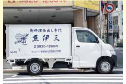
仕出し配達用の車は20台あります