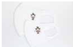
マスク(大人用・お子様用) 各¥400

練馬区内はもちろん、密かに区外からも大人気?! というねり丸のグッズ。新たに種類・デザインが増 えて好評販売中です。発売以来、大好評のねり丸マ スクやメモ帳、マグネットのほか、オリジナルグッ ズを多数取り揃えておりますので、ねりま観光案内 所と石神井観光案内所へぜひお立ち寄りください。