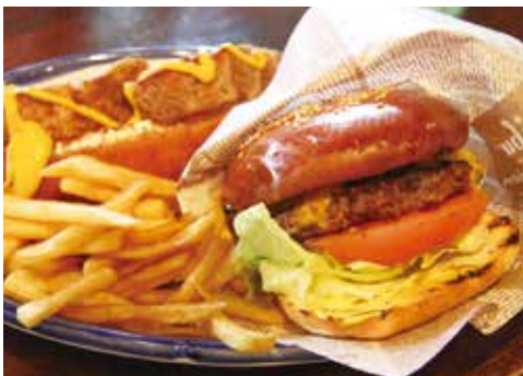
新商品「フィリッポバーガー」の試作

同業者同士であっても、互いに助け合っていくことがより一層大切になると考えています。