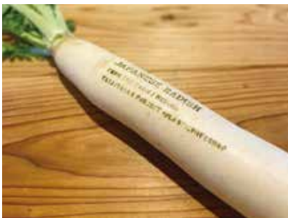
野菜の直接印字は、画期的で「脱プラスチック」を考えるきっかけに

このご縁で白石農園さん（大泉町）と知り合い、私が常日頃から考えていた野菜直売所で「脱プラスチック販売」