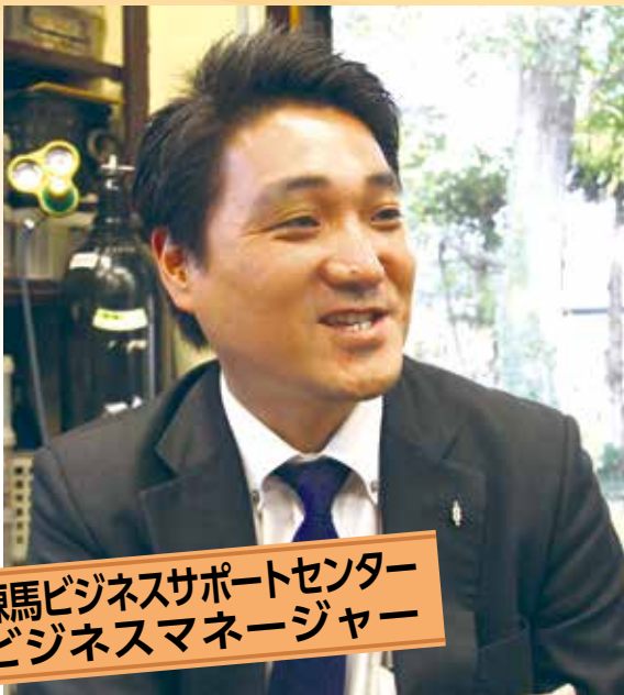
練馬ビジネスサポートセンター ビジネスマネージャー

事業で「こんなことがしたい」という夢へのストーリーがある。ただ実現するためには、資金がいる…。そんな時、助けになるのが補助金です。もちろん、条件に合う補助金が見つかって審査があり、採択されなければなりません。労力もかかるけど、知らないではもったいない！ 補助金を初めて活用した事業者に、申請をサポートした練馬ビジネスサポートセンターのビジネスマネージャーがお話を伺いました。