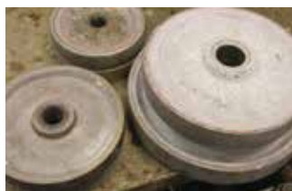
【補助金利用】切り子のヤスリなど工具を購入

ス作品の注文が入ったり、ギャラリーからの引き合いがあったり、さらに2019年1月には上海で初の海外個展をすることになるなど、大きな効果がありました。土・日曜の吹きガラス体験へも、北海道や沖縄からも来てくれるようになったのですが、補助金の目的だったガラス教室への申し込みは、今のところ芳しい結果ではありません。