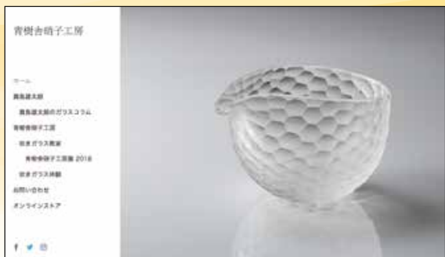
【補助金利用】ホームページのリニューアル

ス作品の注文が入ったり、ギャラリーからの引き合いがあったり、さらに2019年1月には上海で初の海外個展をすることになるなど、大きな効果がありました。土・日曜の吹きガラス体験へも、北海道や沖縄からも来てくれるようになったのですが、補助金の目的だったガラス教室への申し込みは、今のところ芳しい結果ではありません。