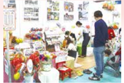
「練馬産業見本市2018」に出展したブース。バルーンアートが子どもたちに人気!

れたら断らない”という気持ちで積極的に交流の場に出ていくことで、区内の社長さんたちから多くのことを教わり、スポンジのように吸収しています。もうここから離れられません(笑)。